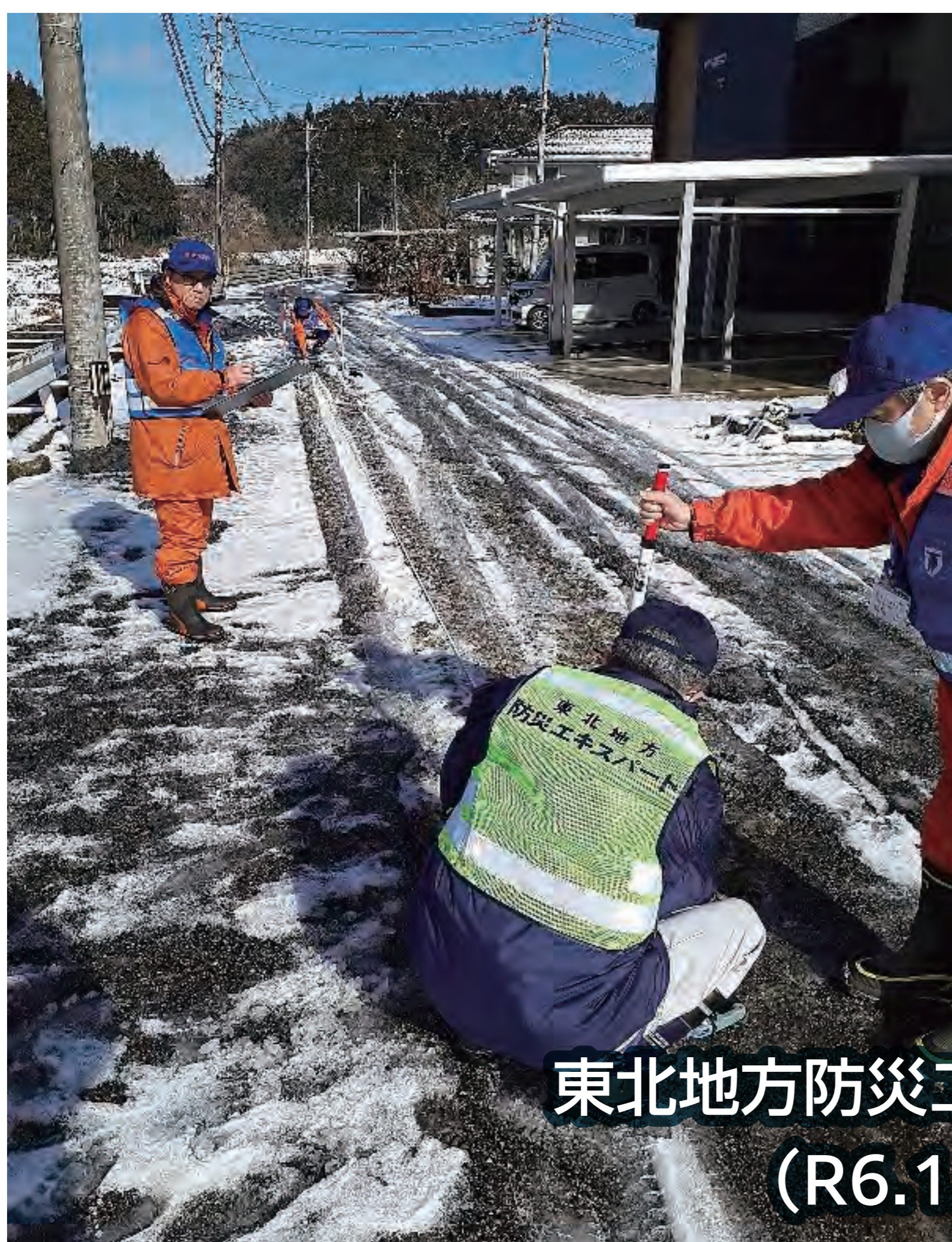
東北地方防災エキスパートと連携した調査 (R6.1.14 石川県穴水町)