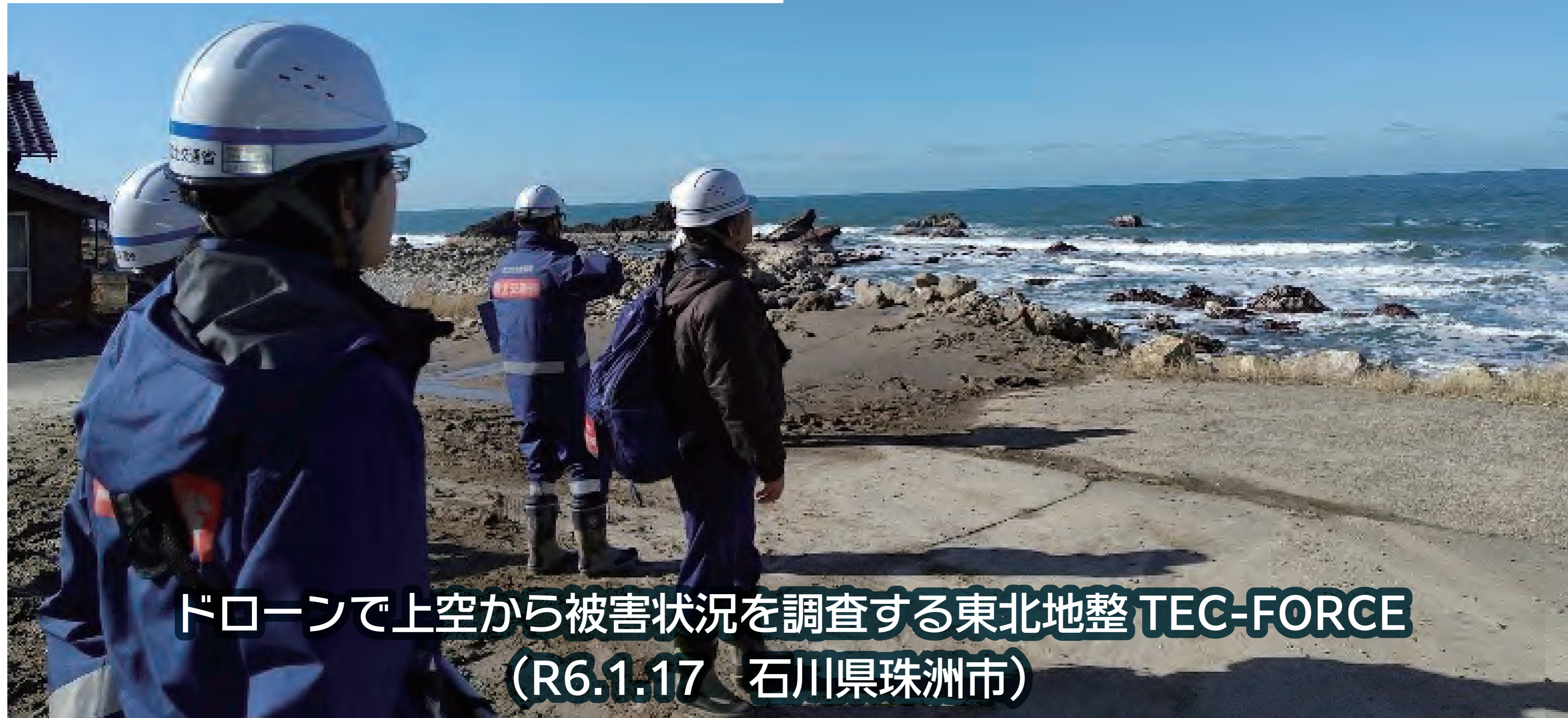
ドローンで上空から被害状況を調査する東北地整 TEC-FORCE (R6.1.17 石川県珠洲市)