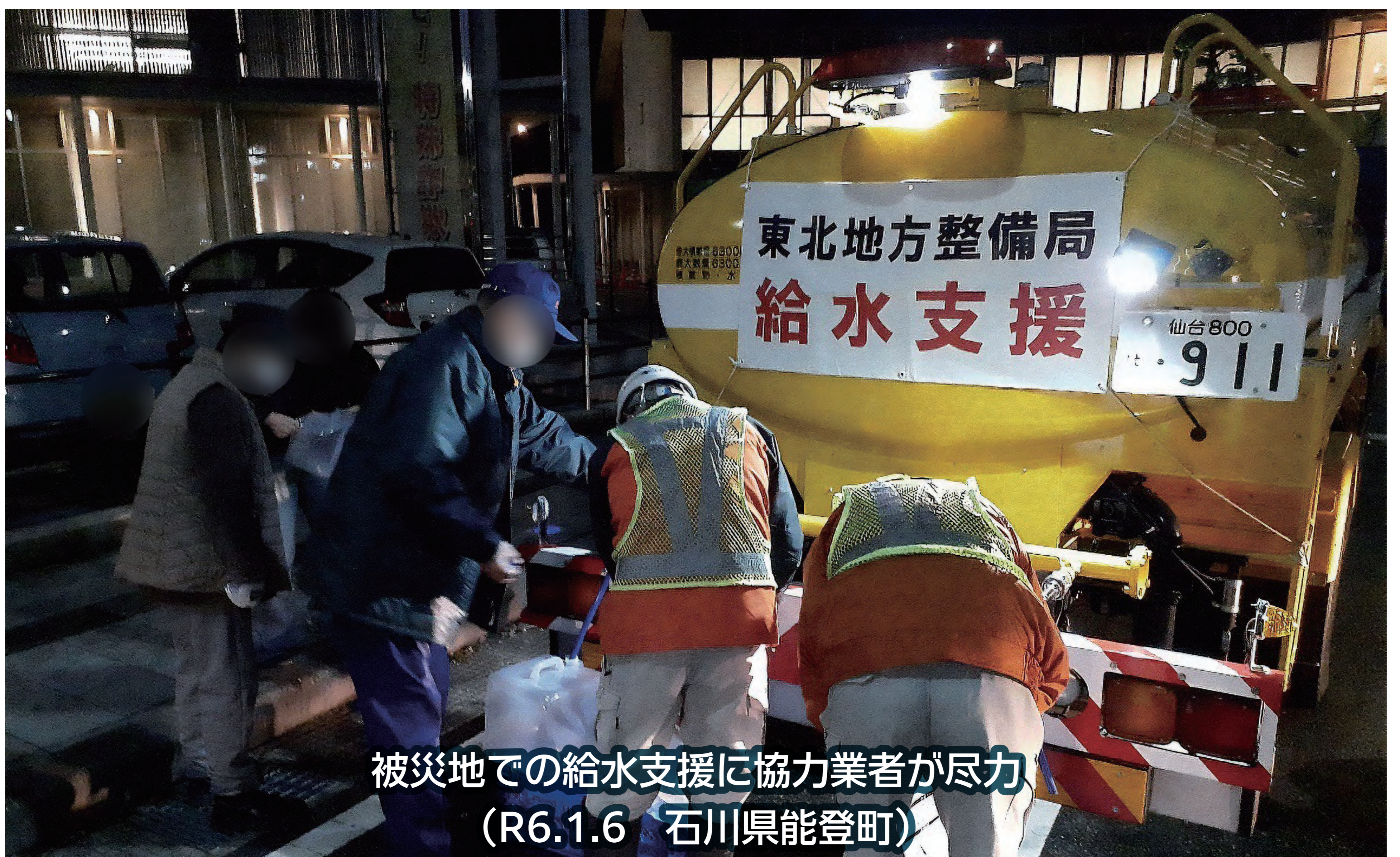
被災地での給水支援に協力業者が尽力 (R6.1.6 石川県能登町)