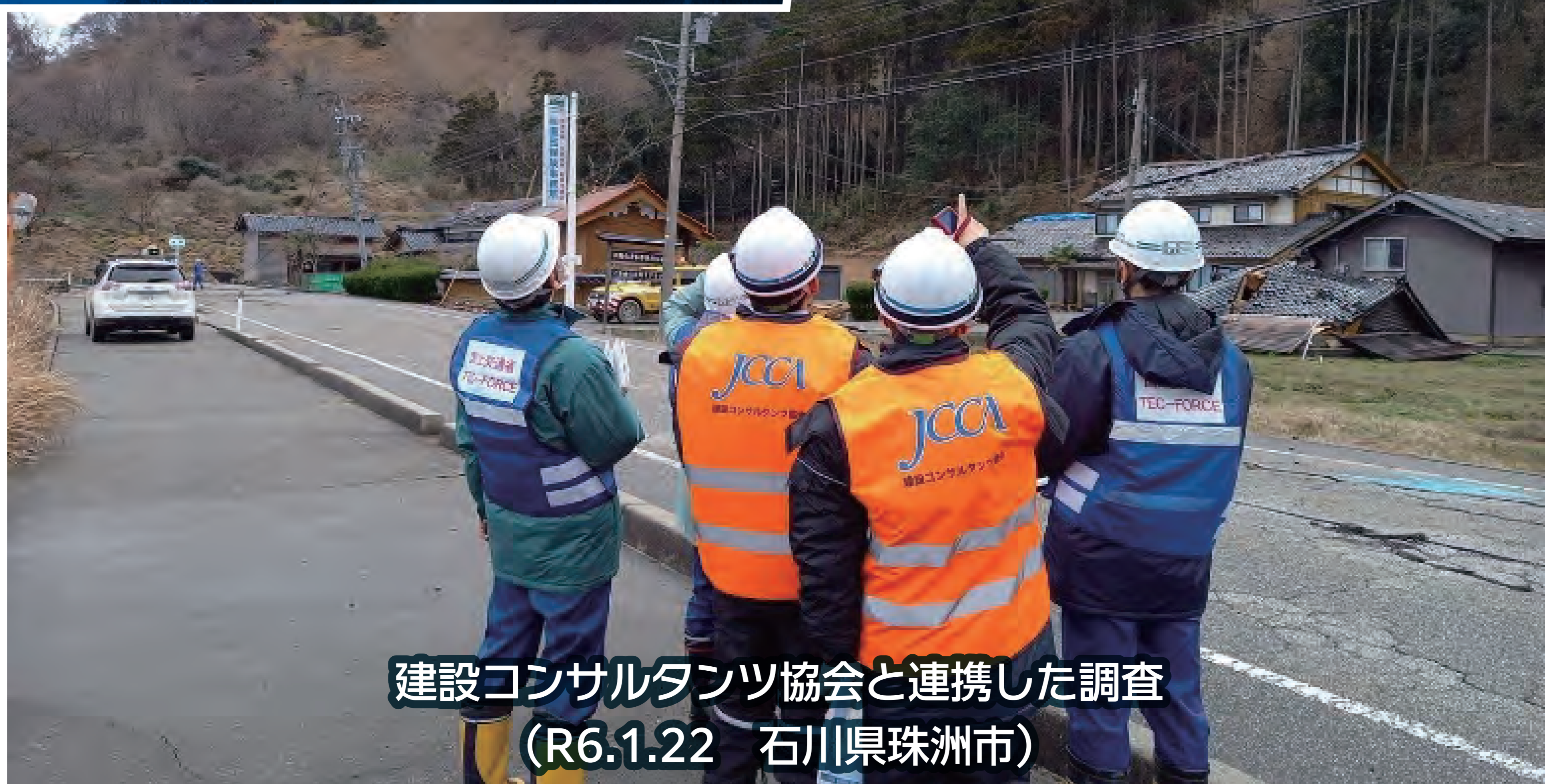
建設コンサルタンツ協会と連携した調査 (R6.1.22 石川県珠洲市)