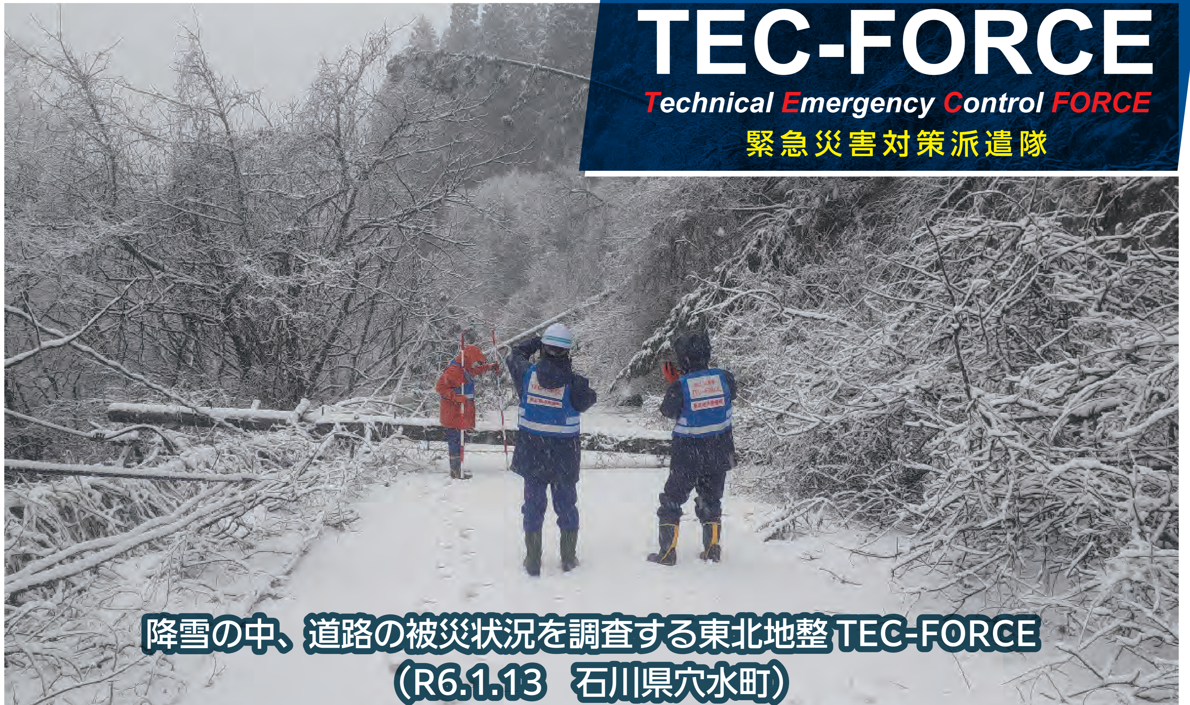
降雪の中、道路の被災状況を調査する東北地整TEC-FORCE (R6.1.13 石川県穴水町)