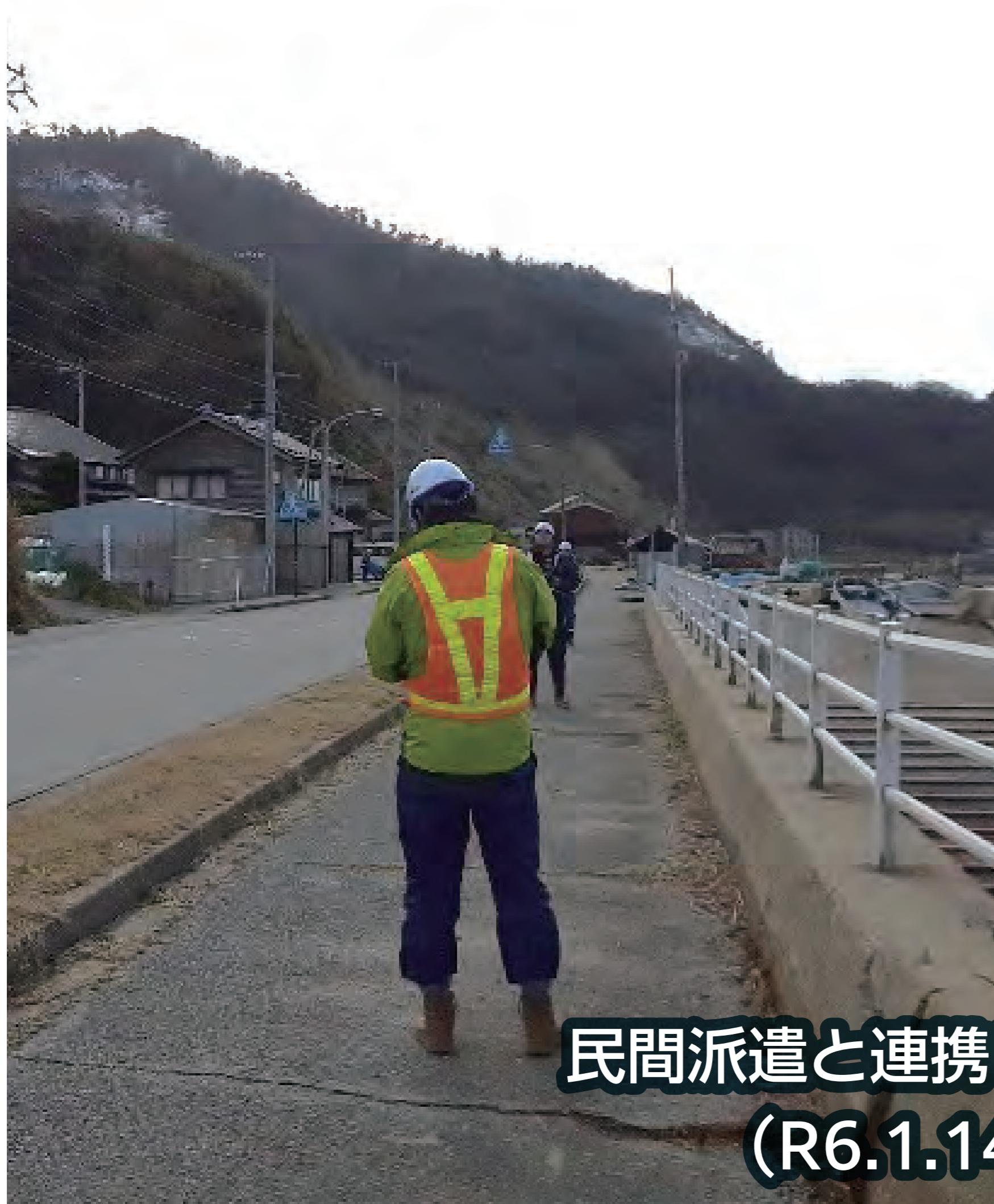
民間派遣と連携したドローンによる調査 (R6.1.14 石川県珠洲市)