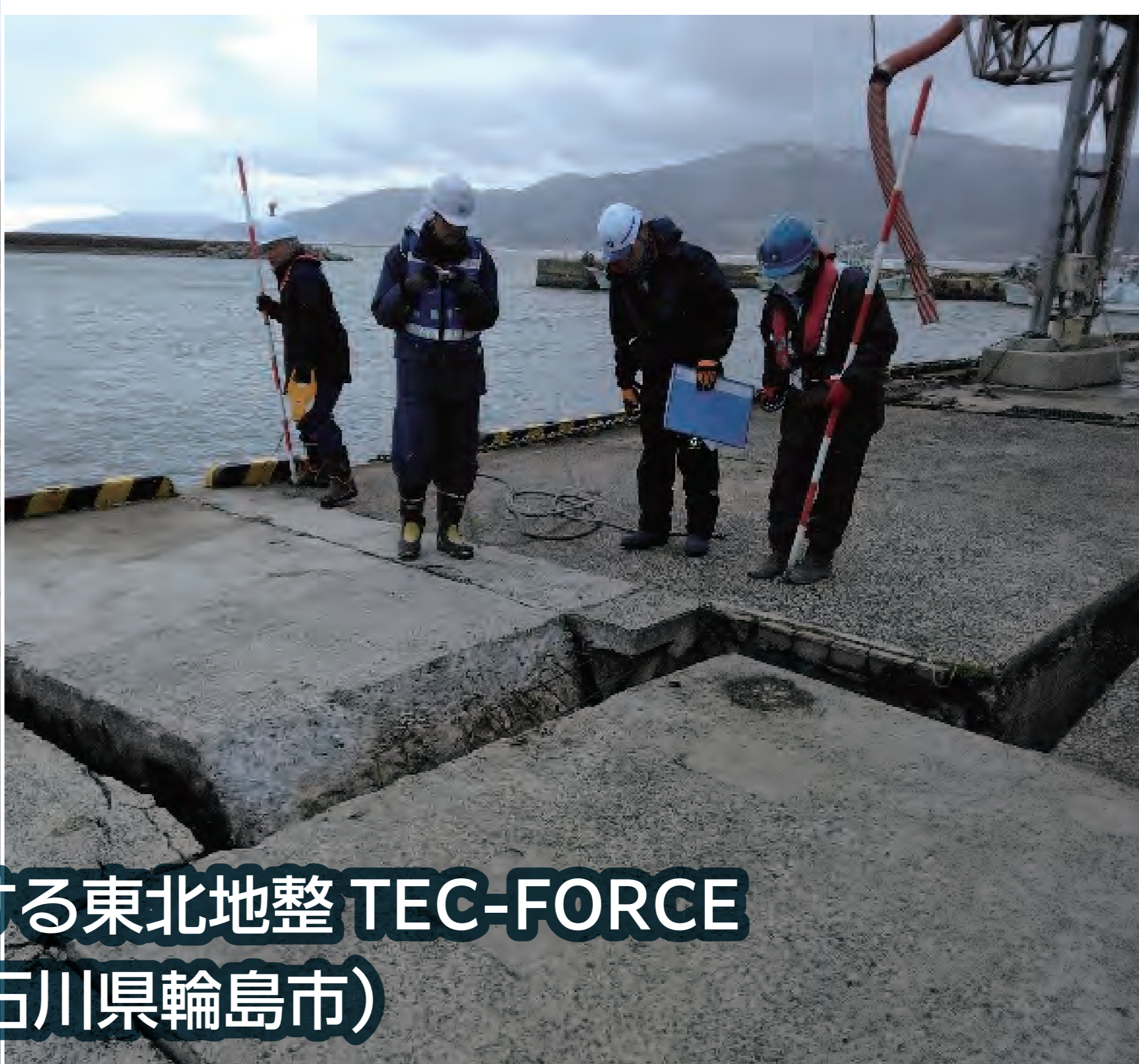
輪島港の被災状況を調査する東北地整 TEC-FORCE (R6.1.15 石川県輪島市)