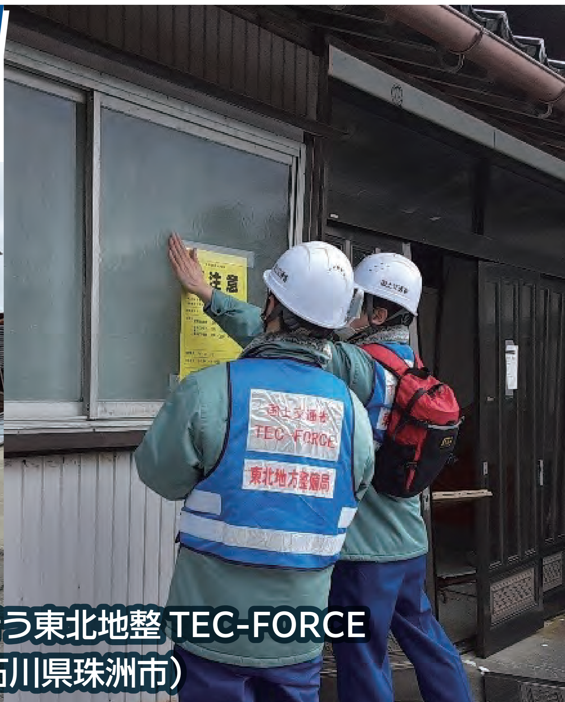
建物の応急危険度判定を行う東北地整 TEC-FORCE (R6.1.19 石川県珠洲市)