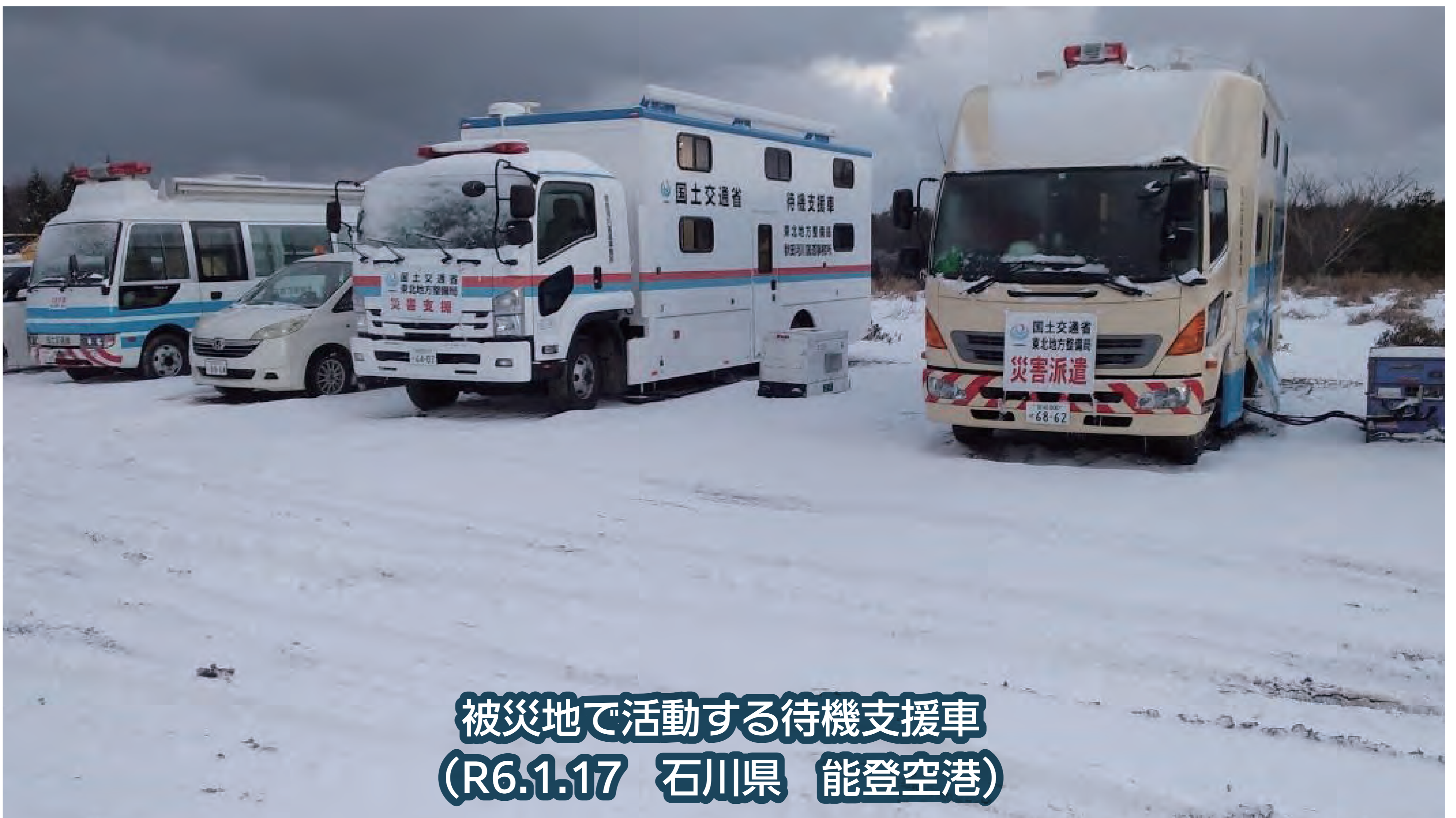
被災地で活動する待機支援車 (R6.1.17 石川県 能登空港)