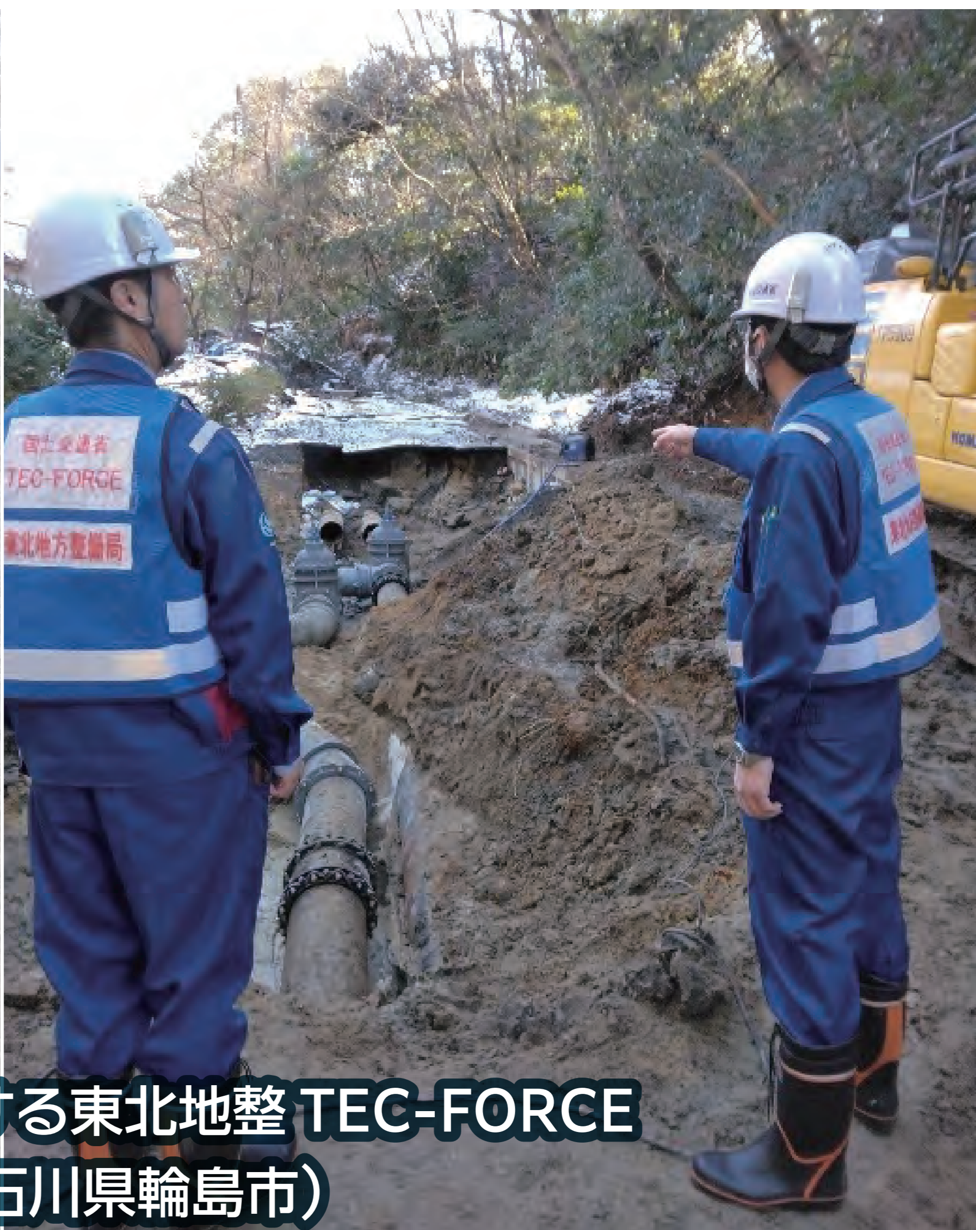
送水管の漏水箇所を確認する東北地整 TEC-FORCE (R6.1.17 石川県輪島市)