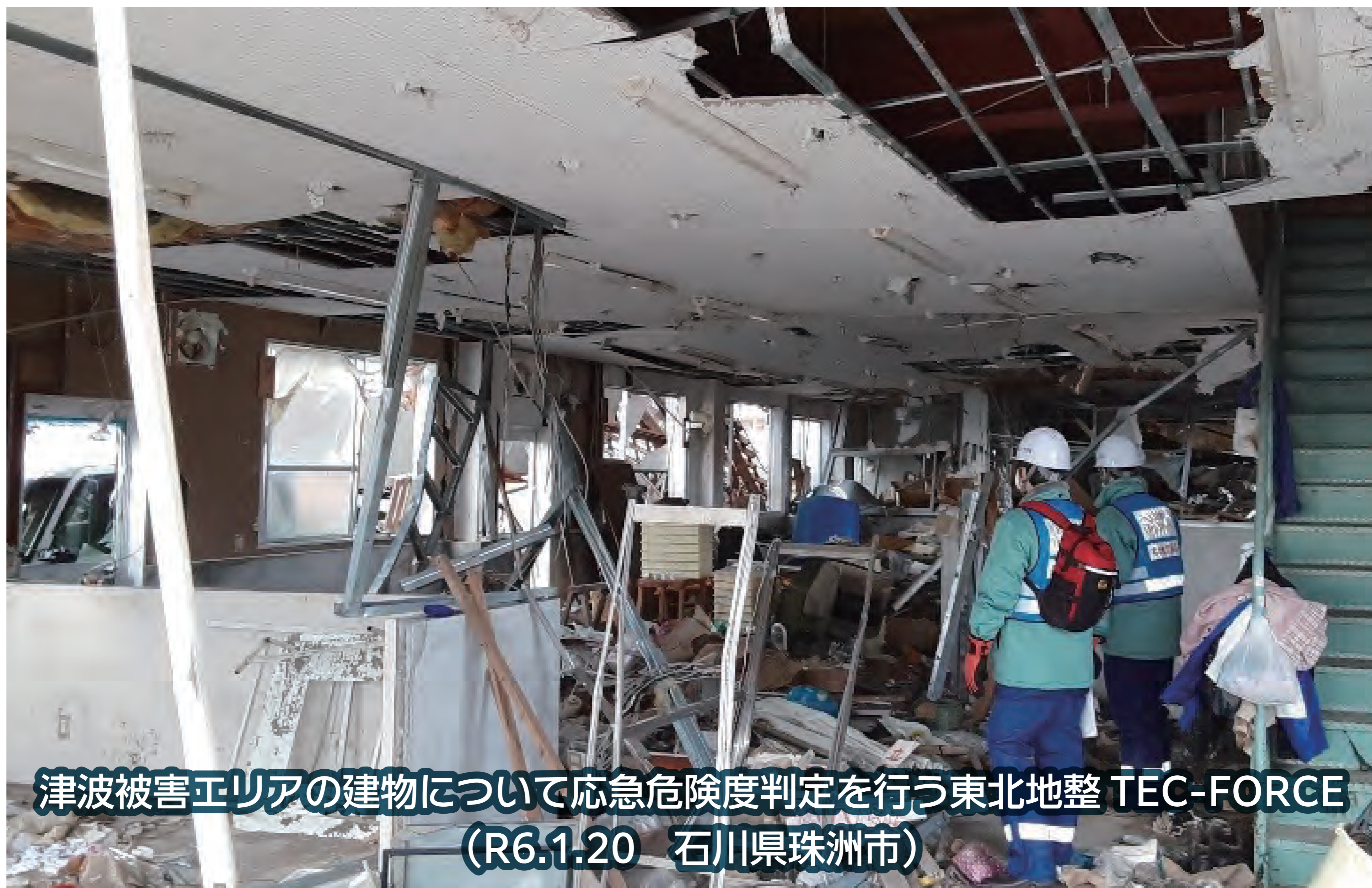
津波被害エリアの建物について応急危険度判定を行う東北地整 TEC-FORCE (R6.1.20 石川県珠洲市)