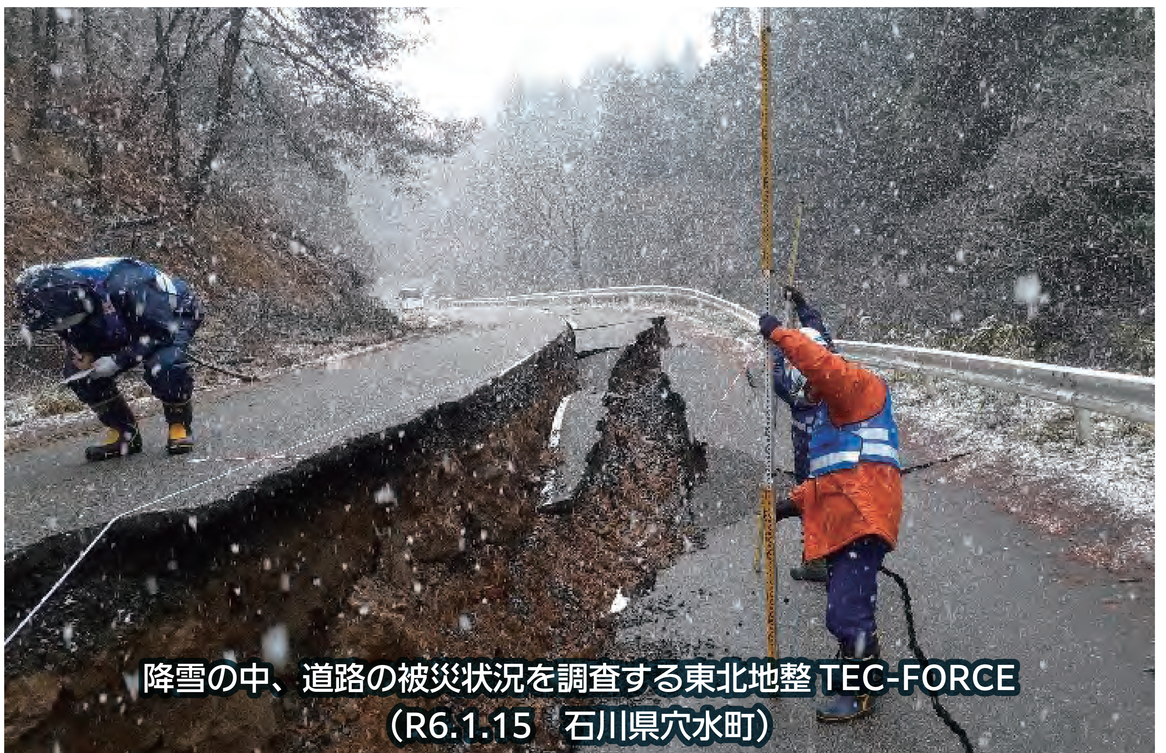
降雪の中、道路の被災状況を調査する東北地整TEC-FORCE (R6.1.15 石川県穴水町)