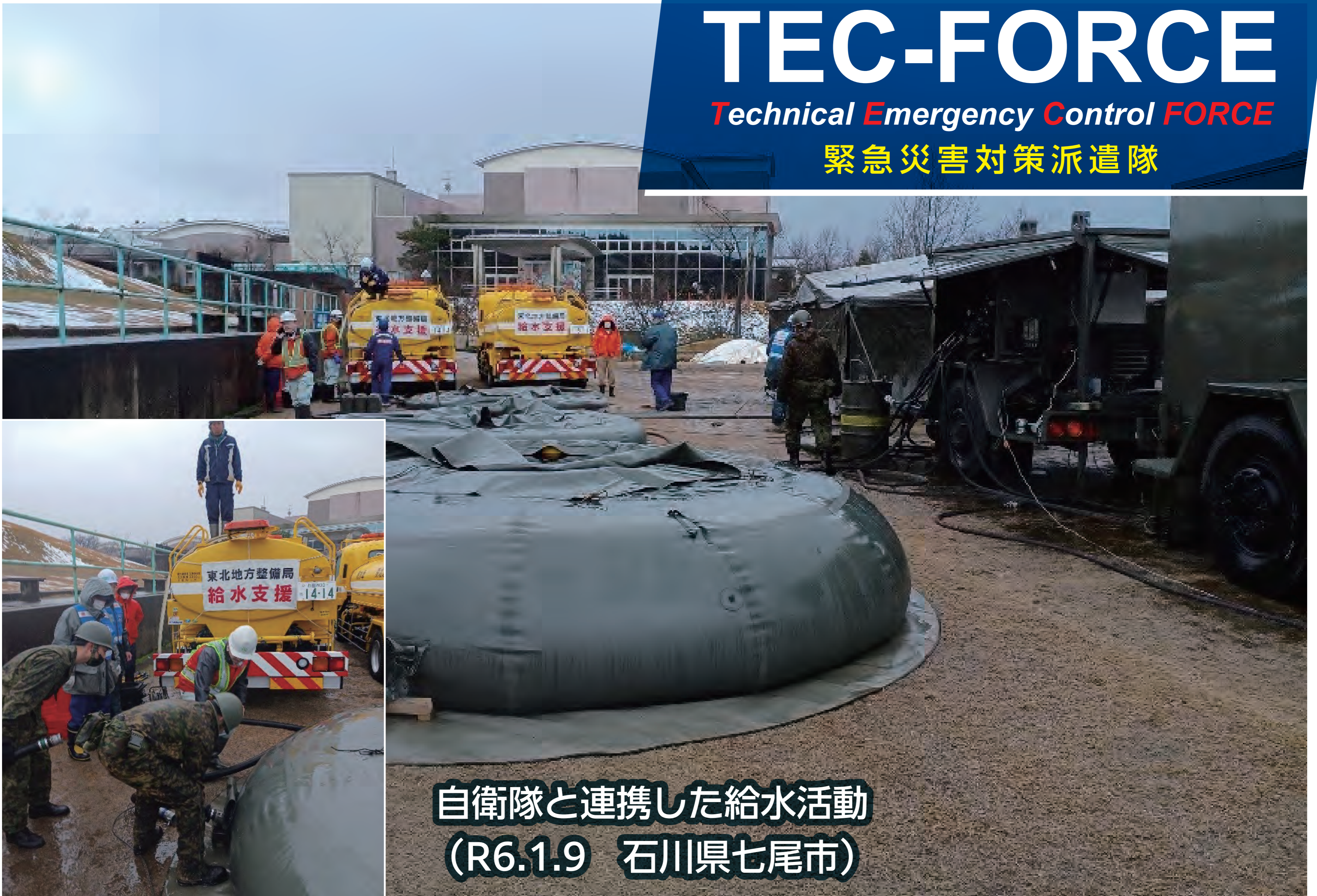
自衛隊と連携した給水活動 (R6.1.9 石川県七尾市)