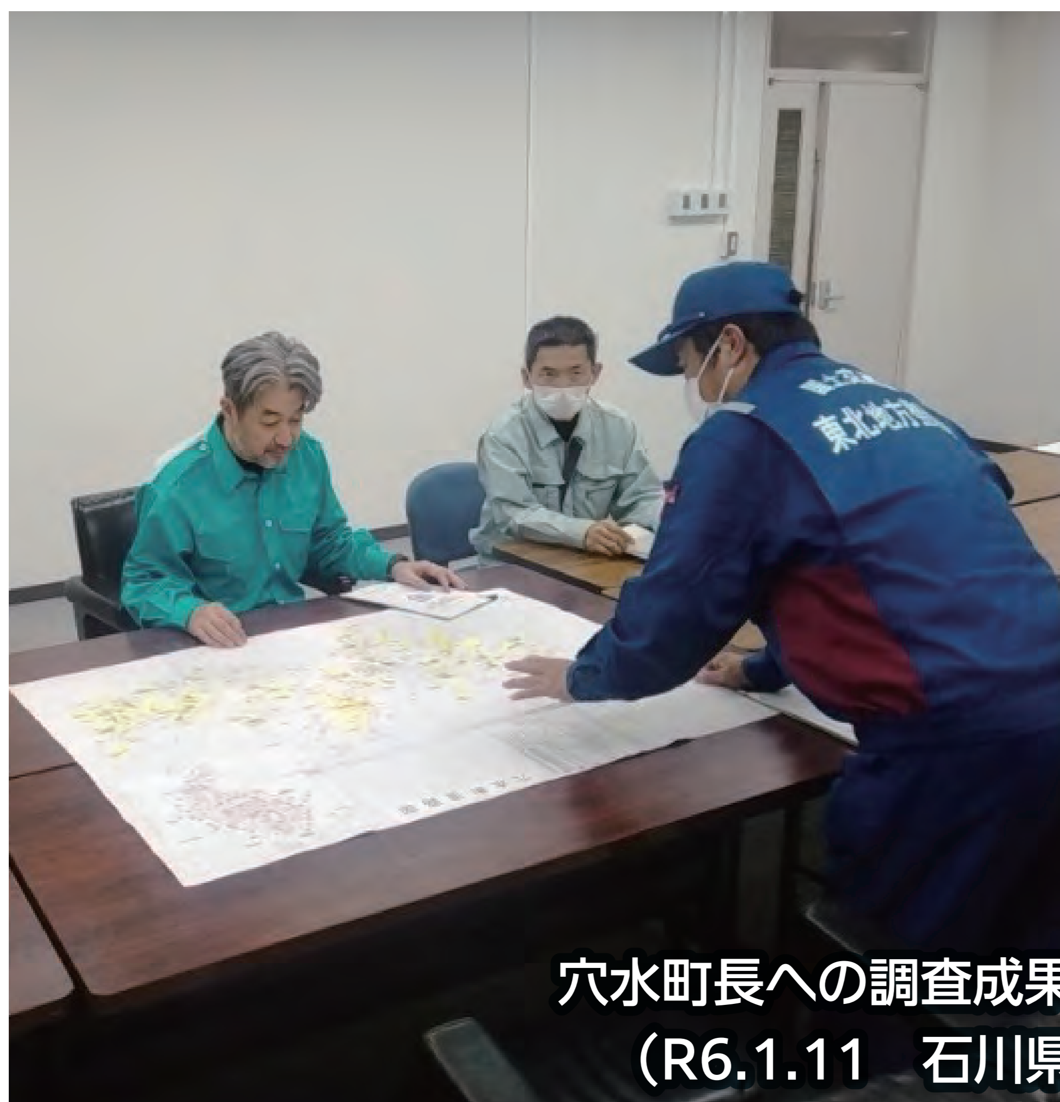
穴水町長への調査成果説明・手交 (R6.1.11 石川県穴水町)