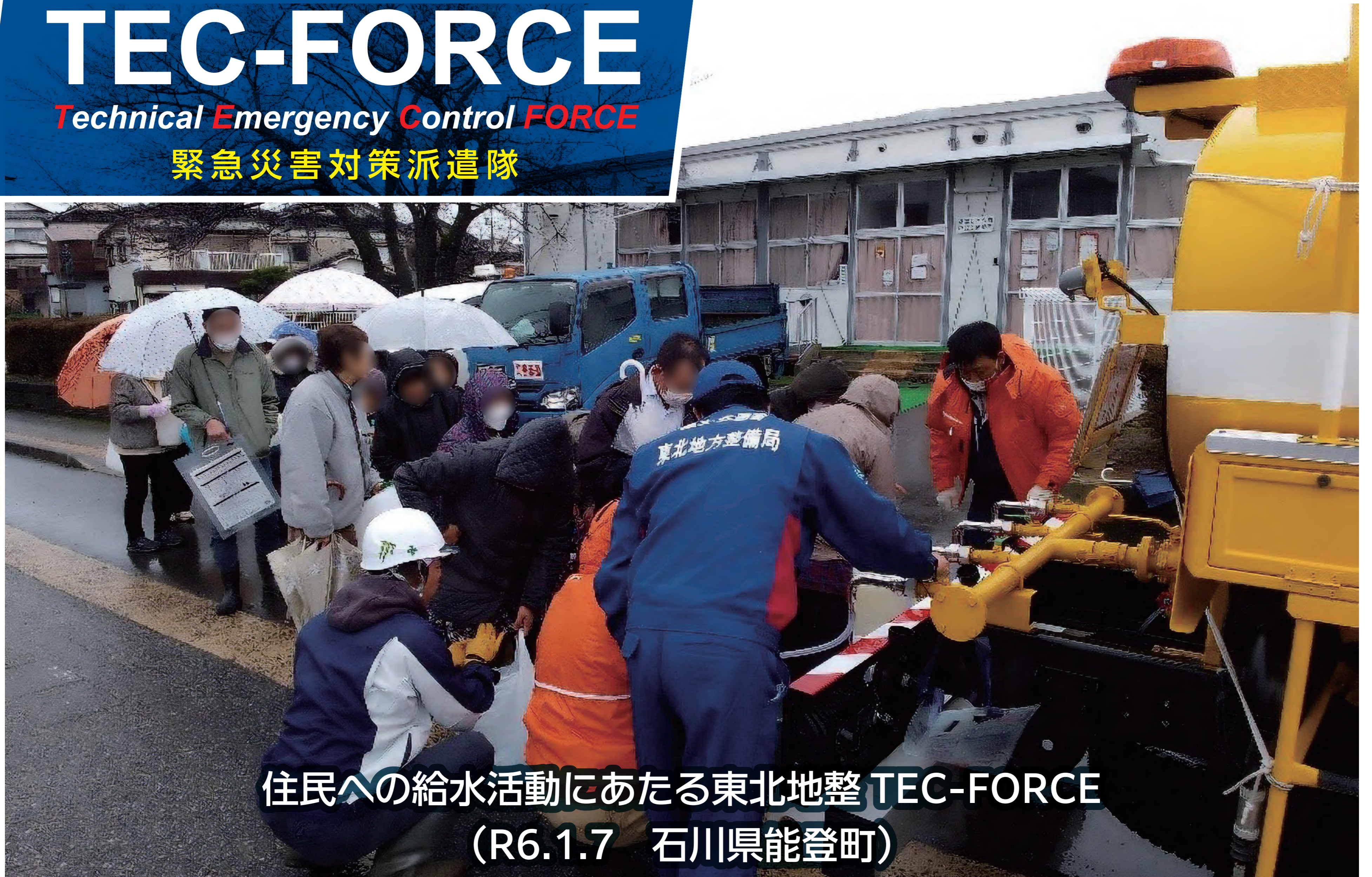
住民への給水活動にあたる東北地整 TEC-FORCE (R6.1.7 石川県能登町)