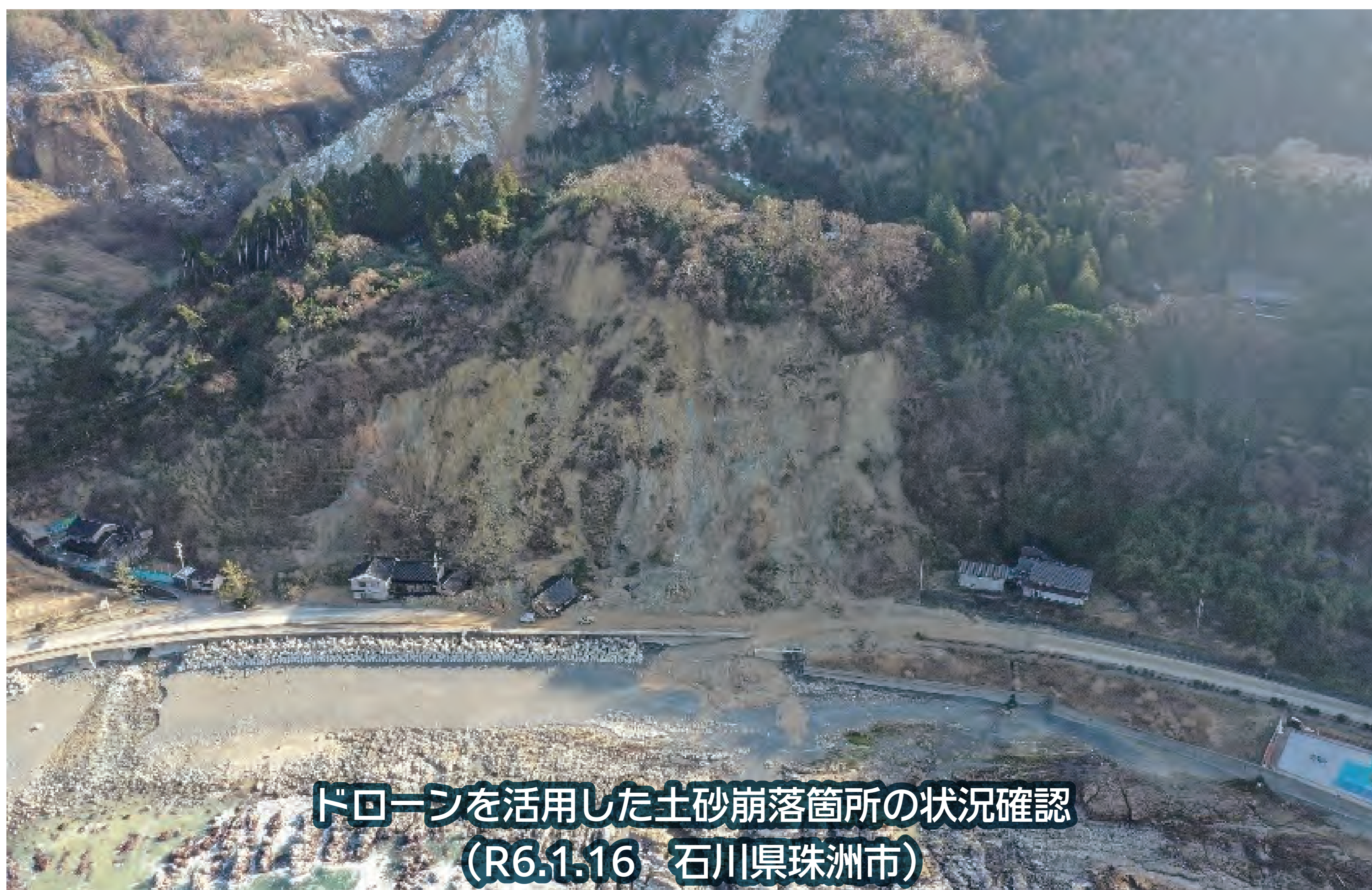
ドローンを活用した土砂崩落箇所の状況確認 (R6.1.16 石川県珠洲市)